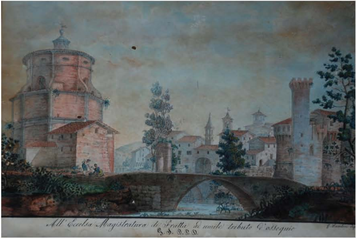
"Fratte vista da nord" - Giovanni Santini (Prima metà dell'800)