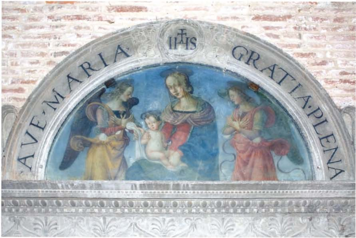
"Madonna col bambino tra due angeli" - Pinturicchio (1504?)