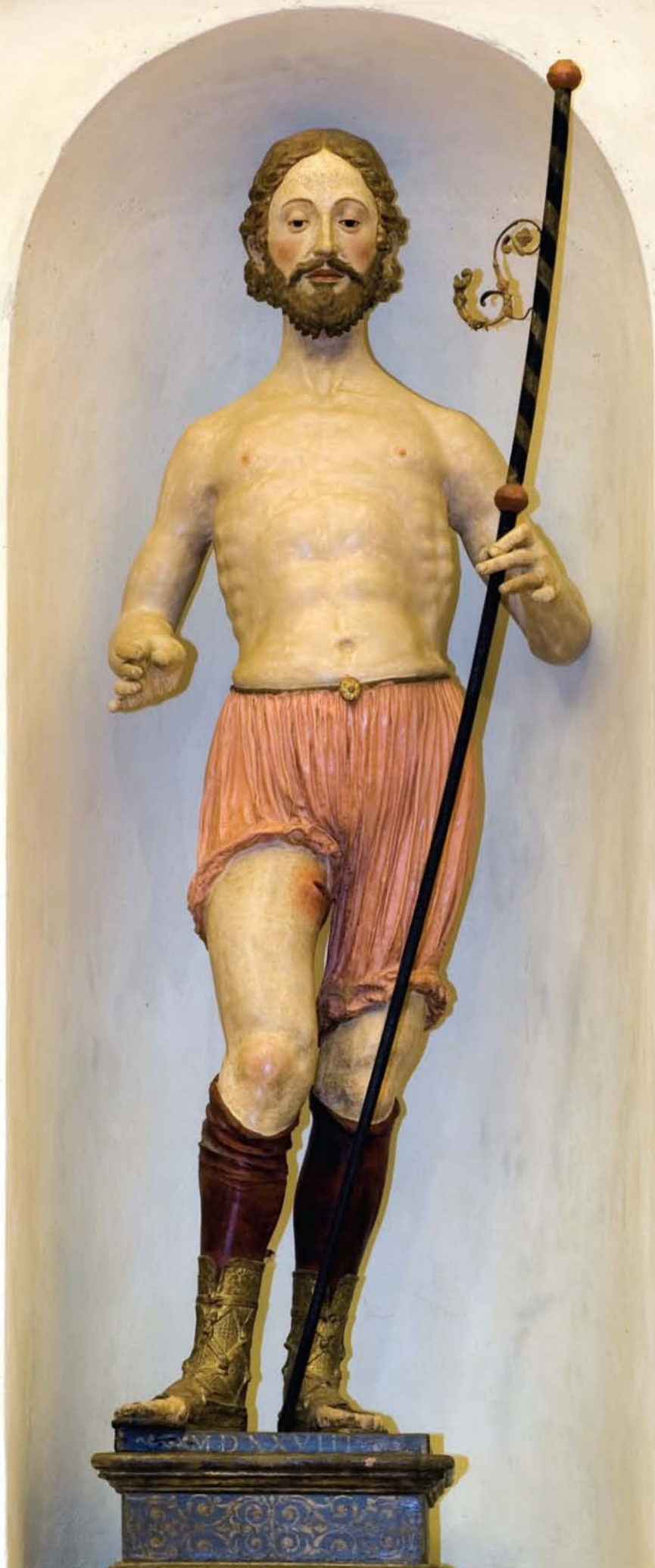
"San Rocco" - Romano Alberti detto Il Nero (1528)