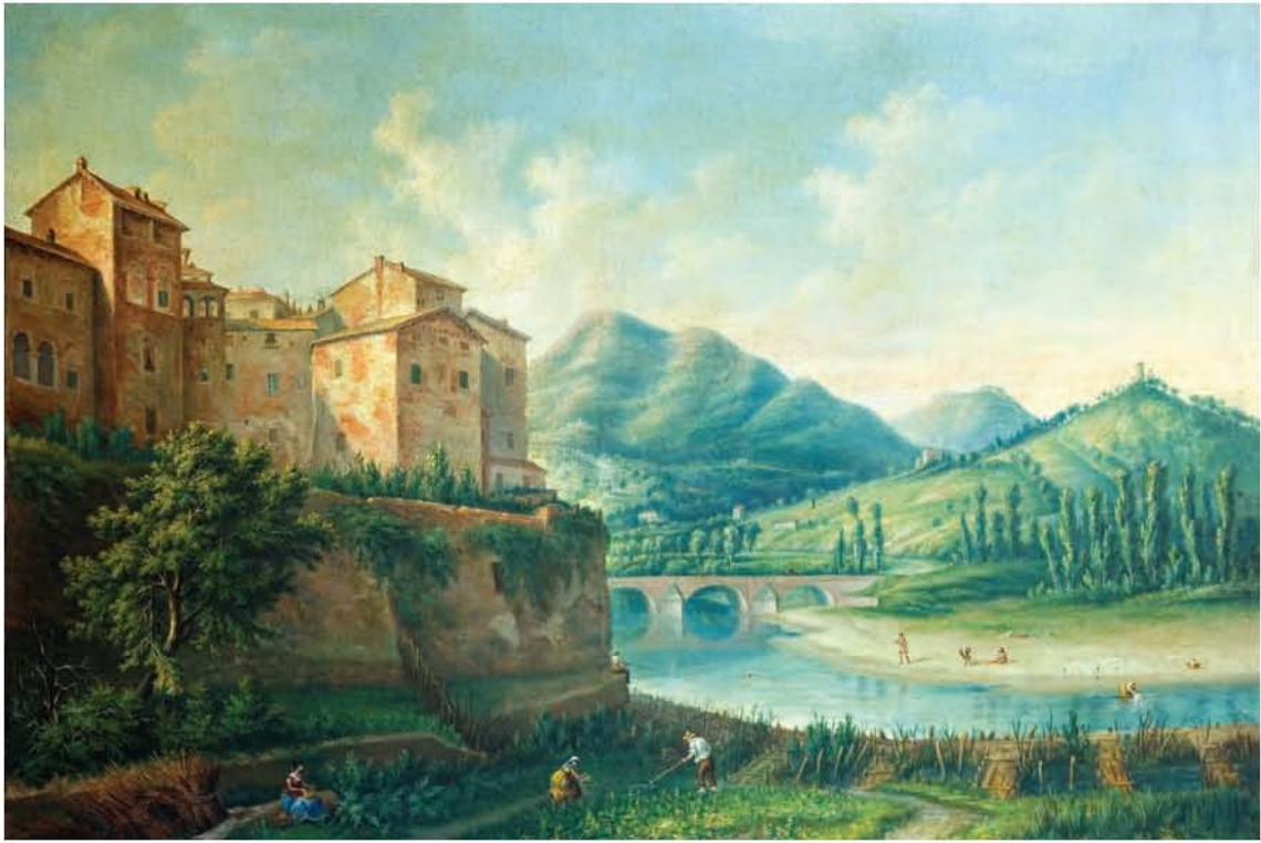
"Il Tevere al Mulinaccio" - Ernesto Freguglia (1874)