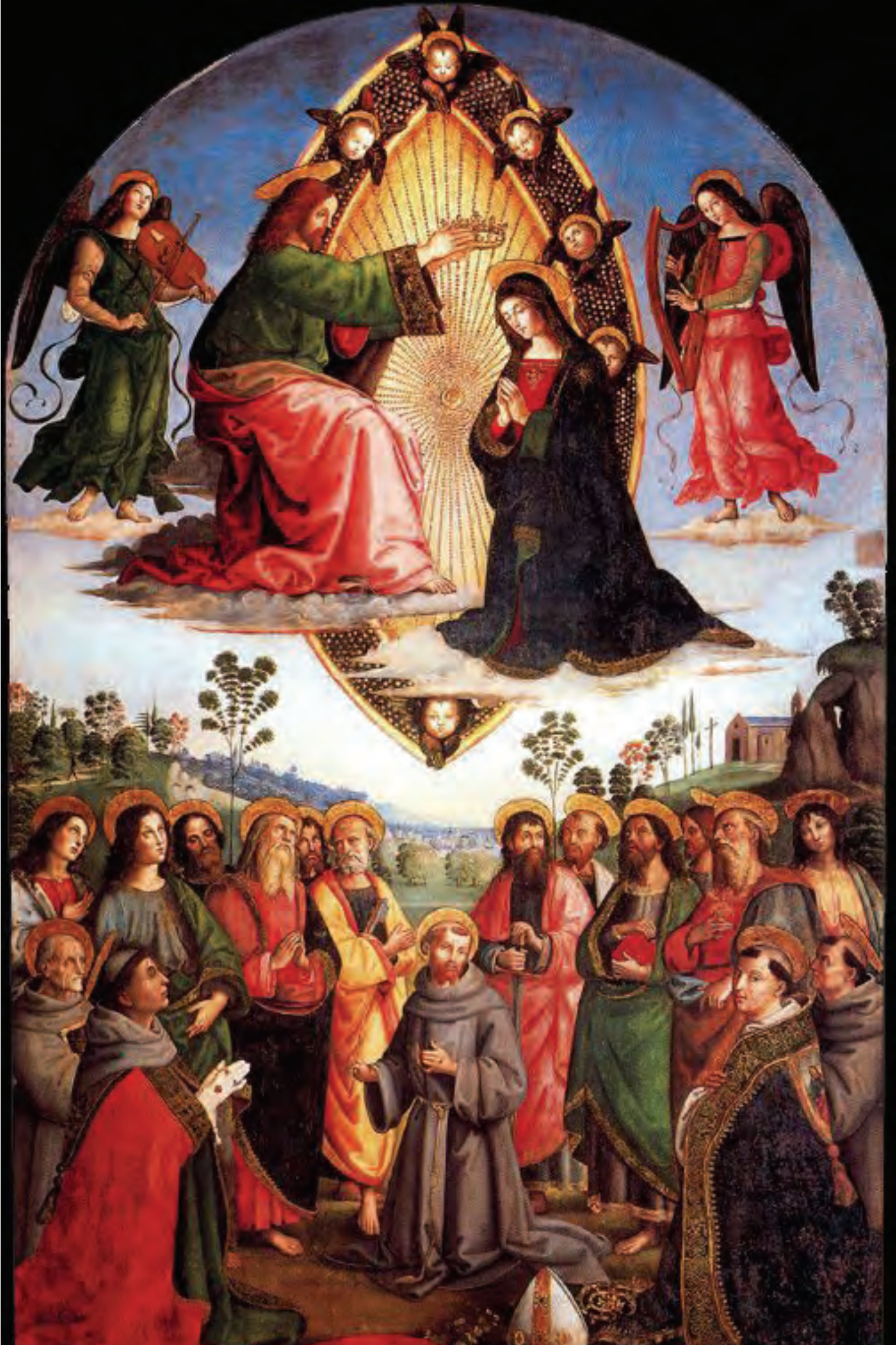
"Incoronazione della Vergine Maria" (conservato in Vaticano) - Pinturicchio (1504?)