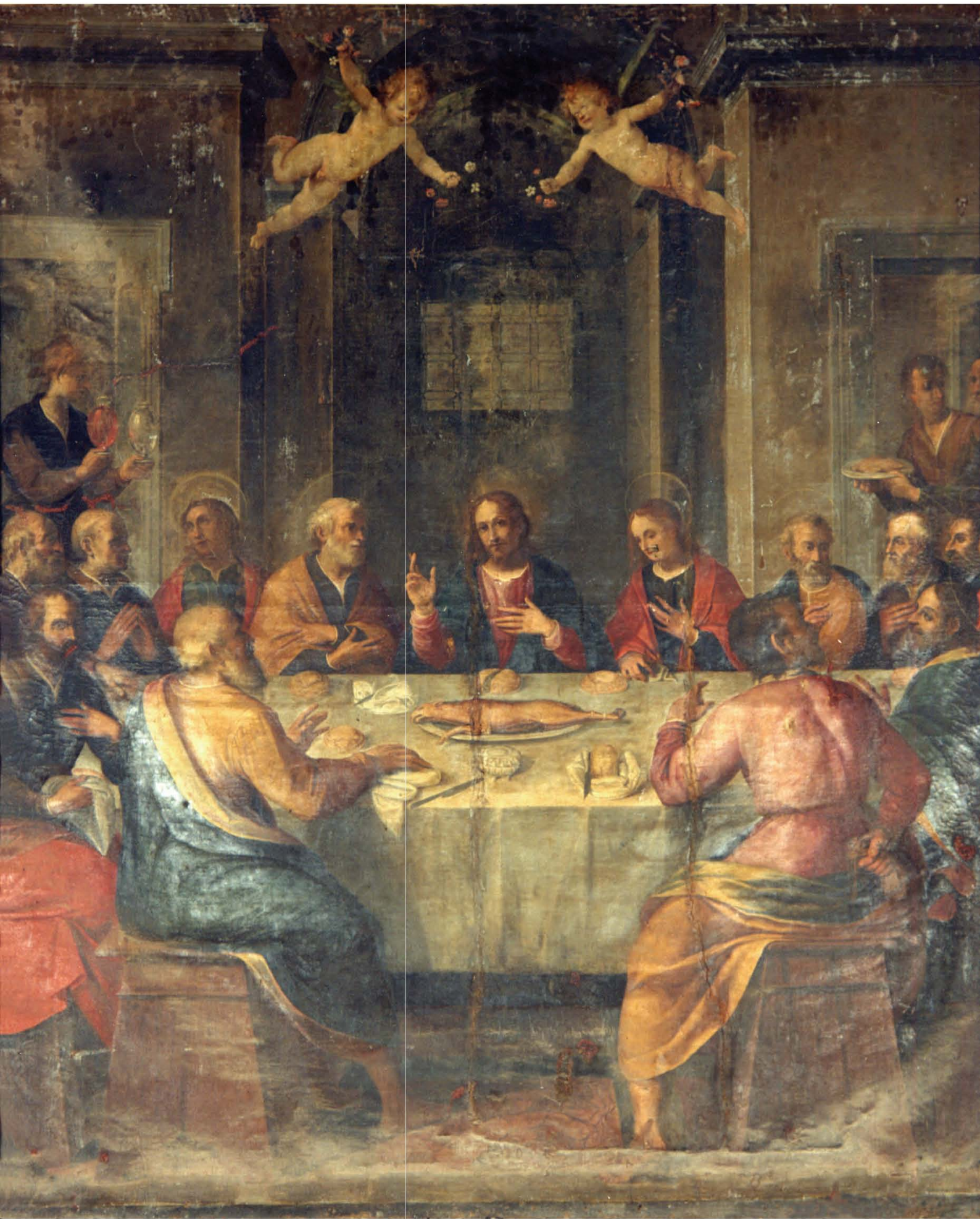
"La cena degli apostoli" - Muzio Fiori (1605)