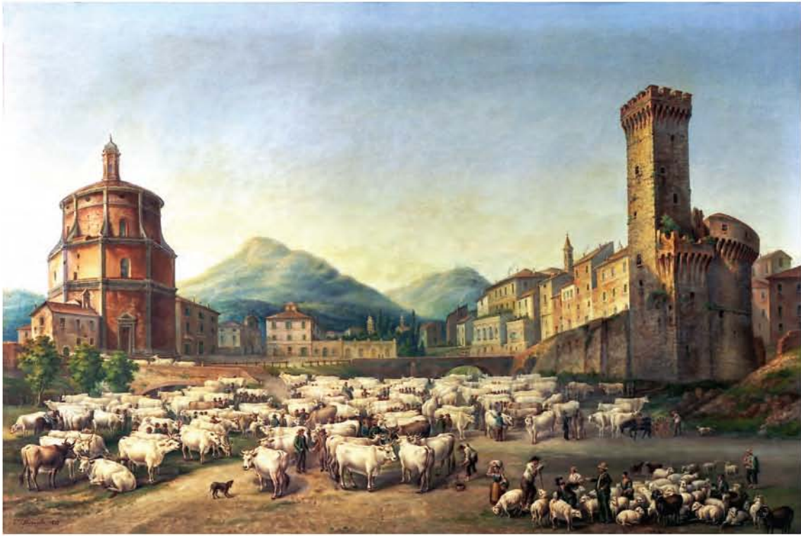
"Il Foro boario" - Ernesto Freguglia (1875)