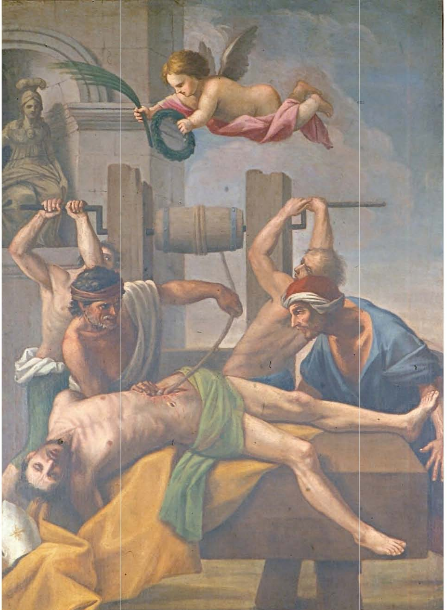
"Martirio di Sant'Erasmus" - Anonimo (XVIII secolo)