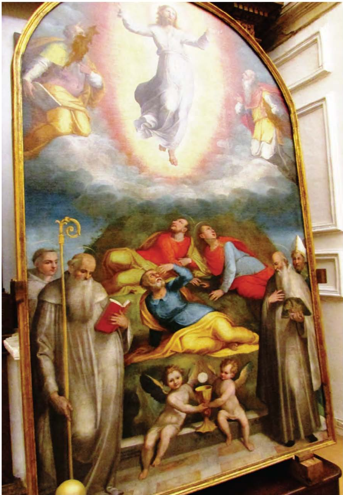
Trasfigurazione di Cristo e Santi – Pomarancio (1578)