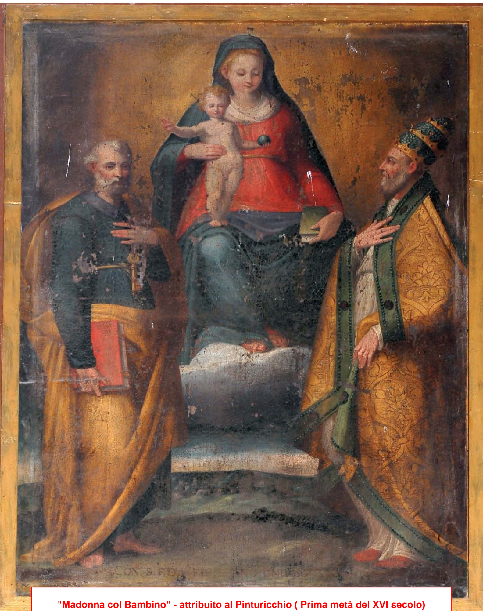
"Madonna col Bambino" - attribuito al Pinturicchio ( Prima metà del XVI secolo)