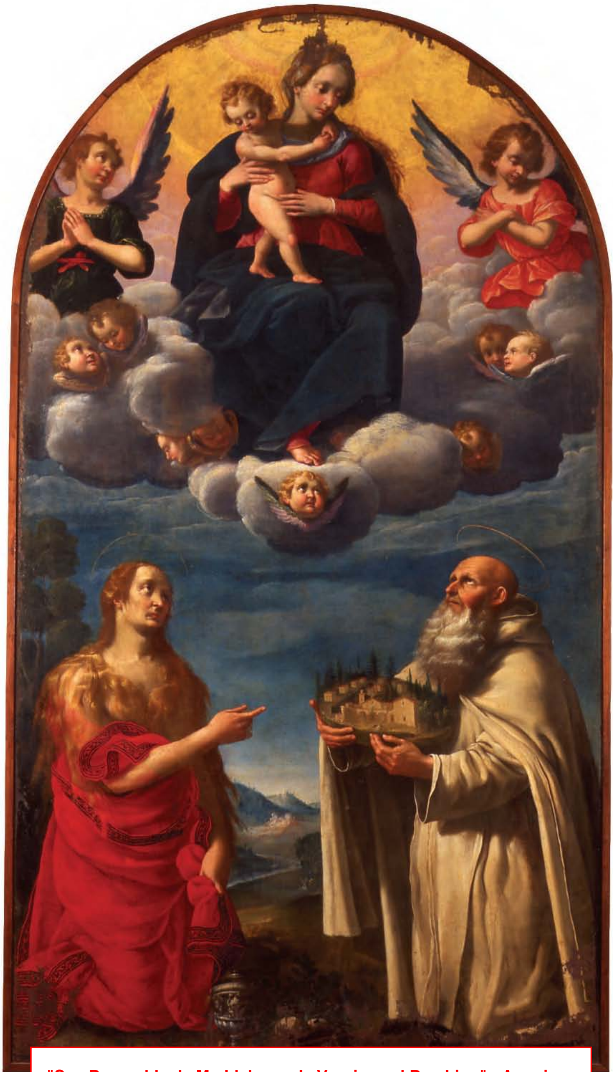
"San Romualdo, la Maddalena e la Vergine col Bambino" - Anonimo