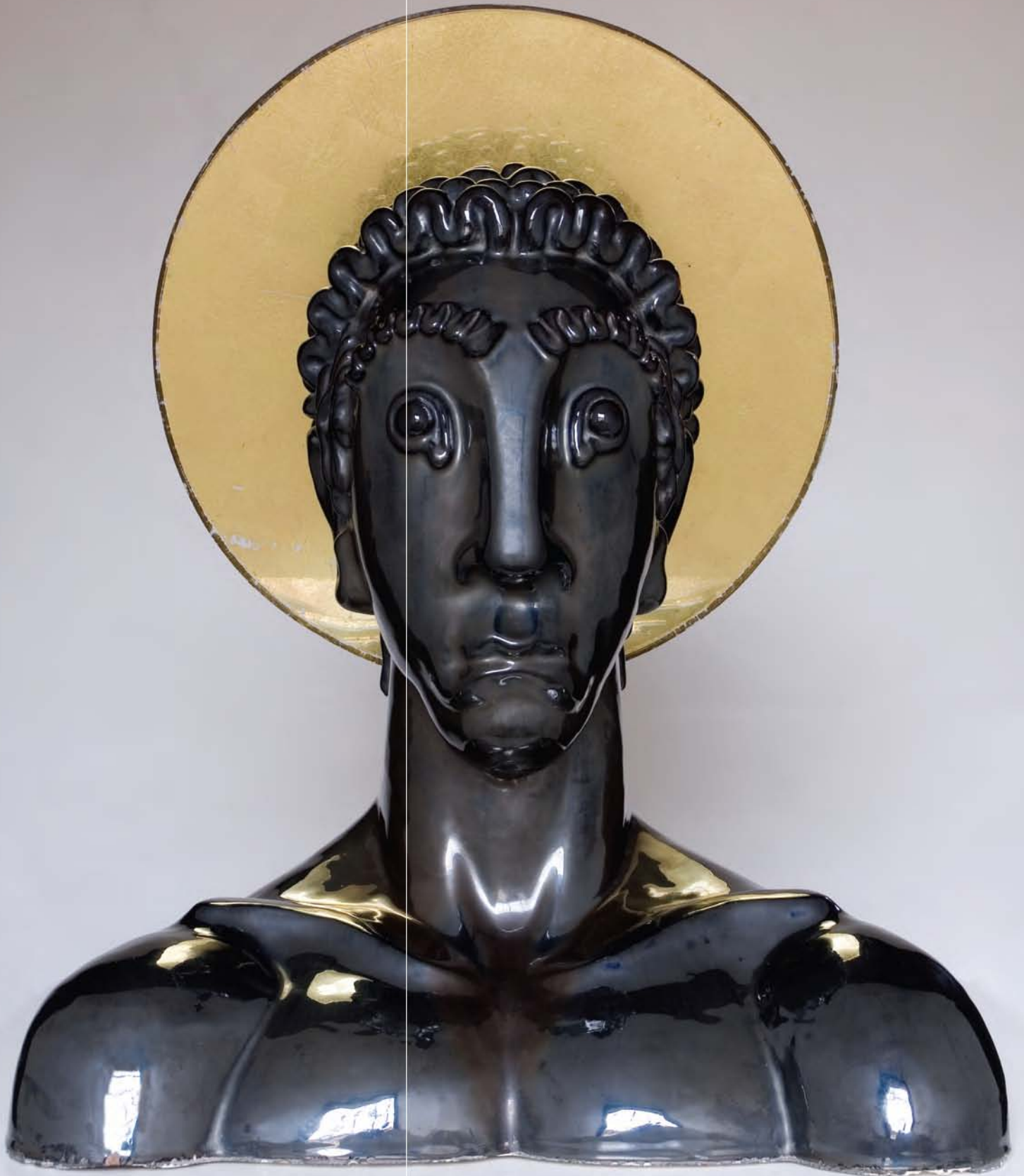
"Il Santone" - Corrado Cagli alle "Ceramiche Rometti" (1927 - 1928)