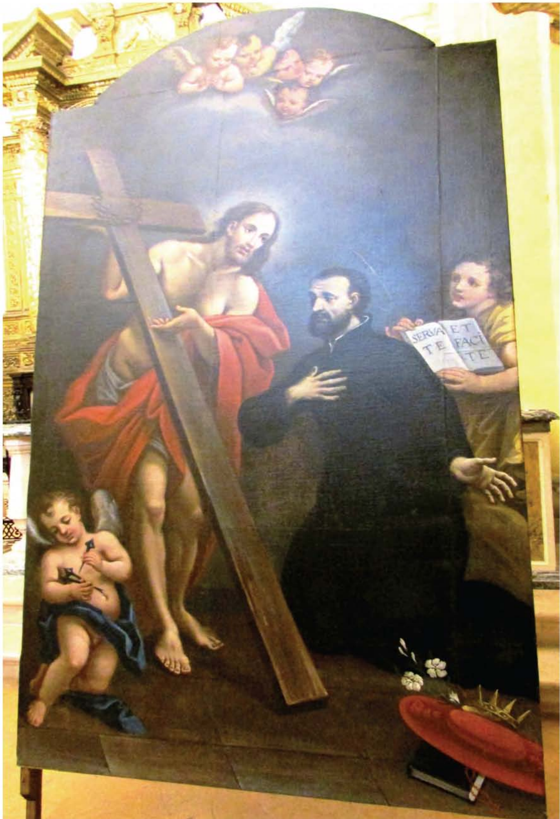
San Gaetano e Cristo Stauroforo – Albornà (1749)