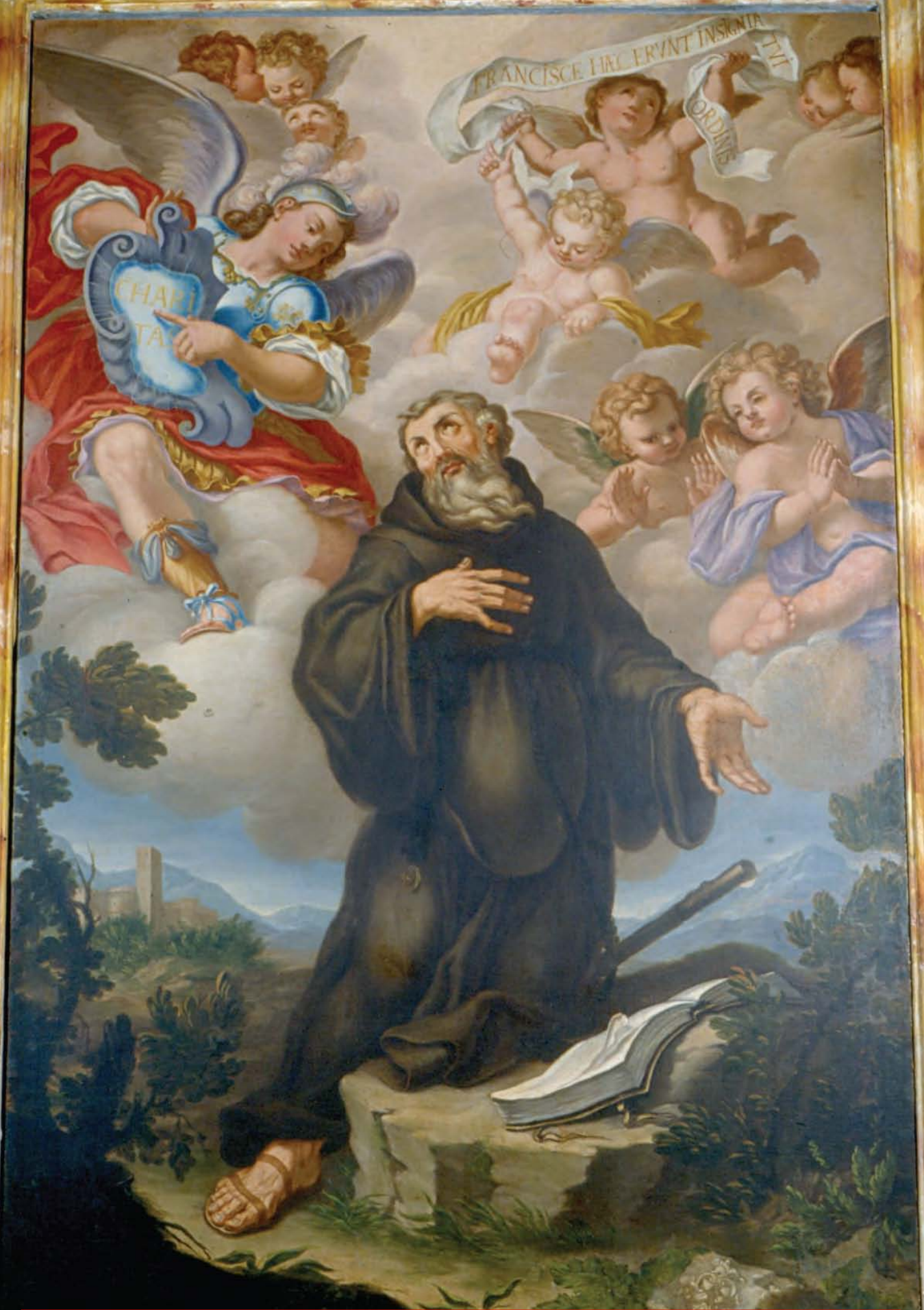
"Predica di San Francesco da Paola" - Anonimo (XVIII secolo)