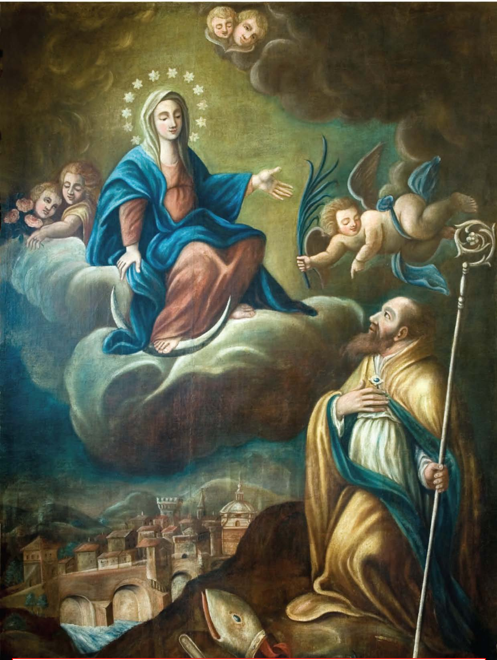
"La Madonna e s. Antonio abate" - Anonimo (XVII secolo)